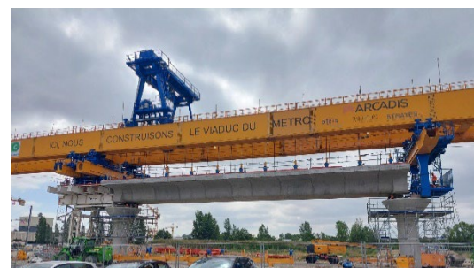
Poutre de lancement