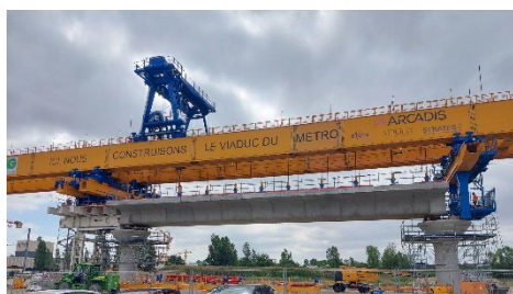
Poutre de lancement